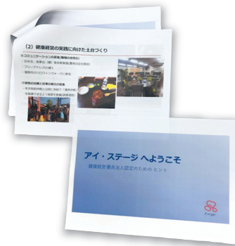
▲他社への啓発活動